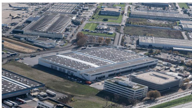
Vue globale de la SC4 sur la zone cargo