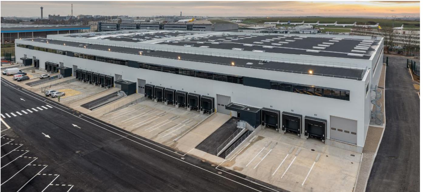
Entrepôt frontière de la SC4 sur l'aéroport Paris-Charles de Gaulle

Cette station cargo constitue une étape supplémentaire dans le développement de la " Cargo City " (zone cargo) de Paris-Charles de Gaulle qui abrite plus de 700 000 m 2 de bâtiments dédiés aux seules activités cargo et fret sur la plateforme aéroportuaire