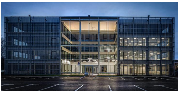
Bâtiment de bureaux